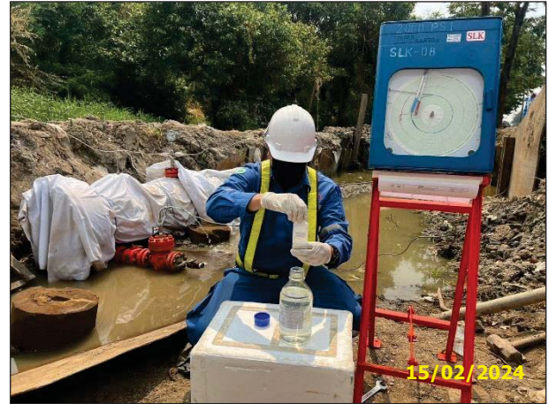
การเก็บตัวอย่างน้ำทิ้งจากการทดสอบท่อฯ ด้วยวิธีทางชลสถิต (Hydrostatic Test) ครั้งที่ 1 เมื่อวันที่ 15 กุมภาพันธ์ พ.ศ. 2567