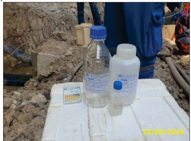
การเก็บตัวอย่างน้ำทิ้งจากการทดสอบท่อฯ ด้วยวิธีทางชลสถิต (Hydrostatic Test) ครั้งที่ 2 เมื่อวันที่ 13 มีนาคม พ.ศ. 2567

รูปที่ 3-4 การติดตามตรวจสอบคุณภาพน้ำทิ้งจากการทดสอบท่อโดยวิธีทางชลสถิต (Hydrostatic Test)