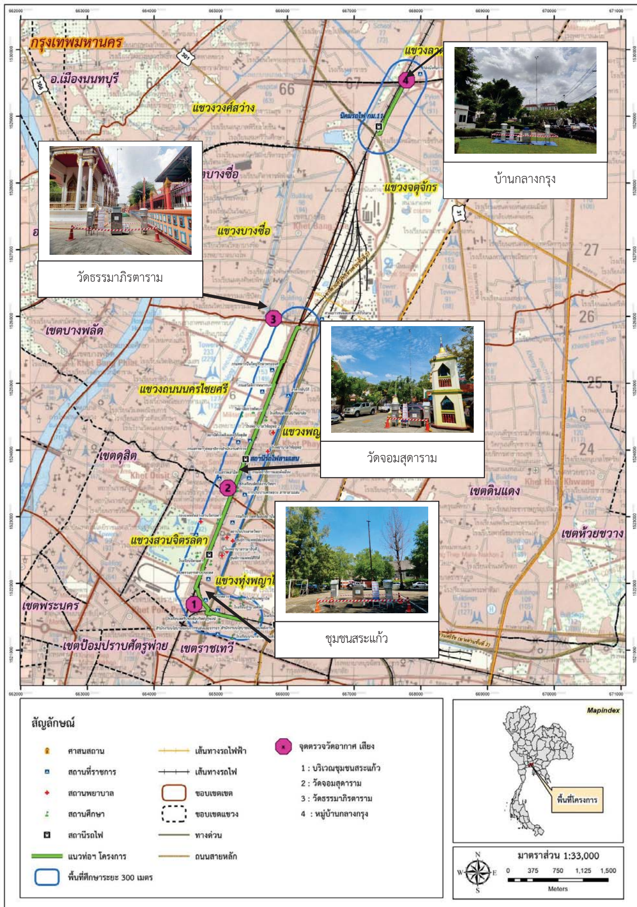
รูปที่ 3-1 แผนที่แสดงตำแหน่งสถานีตรวจวัดคุณภาพอากาศ ในระยะก่อสร้างโครงการ